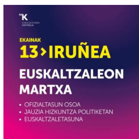
Karrantua Jaitsi hemen