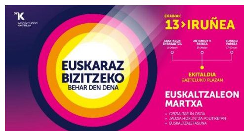
Horizontala Jaitsi hemen