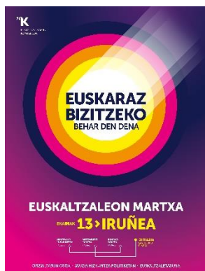
Instagram / Facebook / Whatsapp Jaitsi hemen

Sare sozialetarako formatu eta tamaina ezberdinetara egokitu dugu kartela. Jaisteko sakatu irudien gainean.