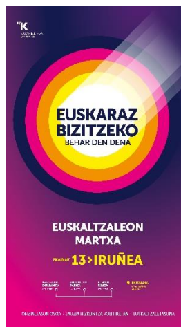
Instagram Stories Jaitsi hemen